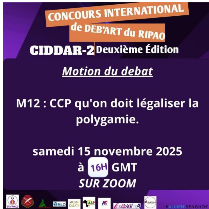
Figure 1 : Motion de la première journée de débat

A l'issue de cette phase, 16 candidats, soit 8 binômes ont été retenus pour les demi-finales. Chaque orateur avait droit à au moins 3 matchs. 16 classes zoom nous ont permis de faire passer tous les orateurs, de manière simultanée, dès le premier jour.