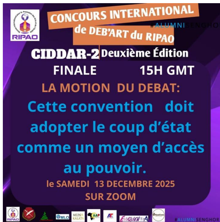
Figure 3: Motion de la finale