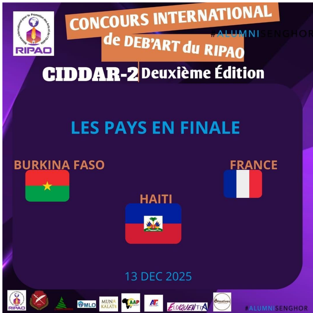
Figure 2 : Pays demi-finalistes

La sélection des demi-finalistes a également constitué un moment clé du concours, avec 16 binômes retenus à l'issue des phases préliminaires. Ces binômes, composés des meilleurs orateurs, ont démontré leurs compétences exceptionnelles et leur capacité à captiver le jury. Leur parcours jusqu'à cette étape témoigne de l'engagement aux valeurs de l'éloquence et du débat, élevant ainsi le niveau de la compétition et faisant briller le talent francophone